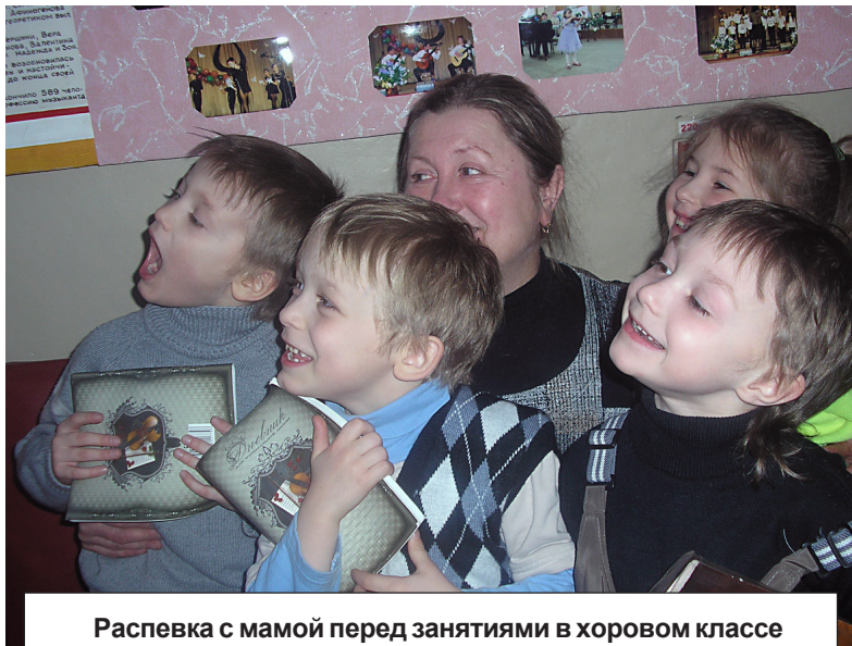
Распевка с мамой перед занятиями в хоровом классе